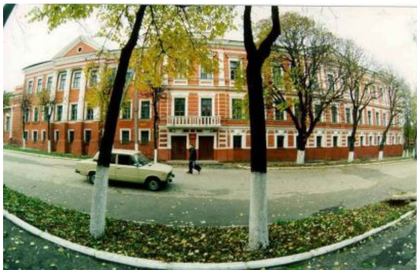
Здание Рыльского аграрного колледжа

01 октября. 95 лет со дня открытия (01.10.1921) Рыльского аграрного техникума, ныне Рыльского аграрного колледжа.