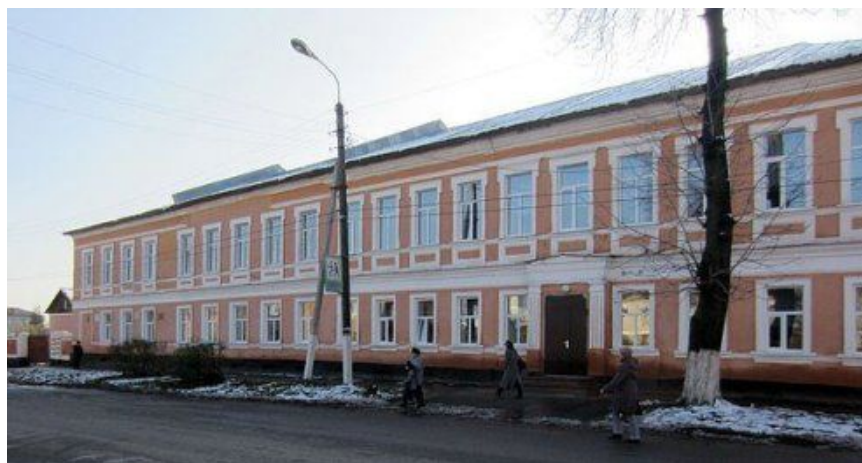
Здание школы №1

07 апреля. 135 лет со дня открытия (07.04.1881) Рыльская средняя общеобразовательная школа №1 им. Г.И. Шелехова»